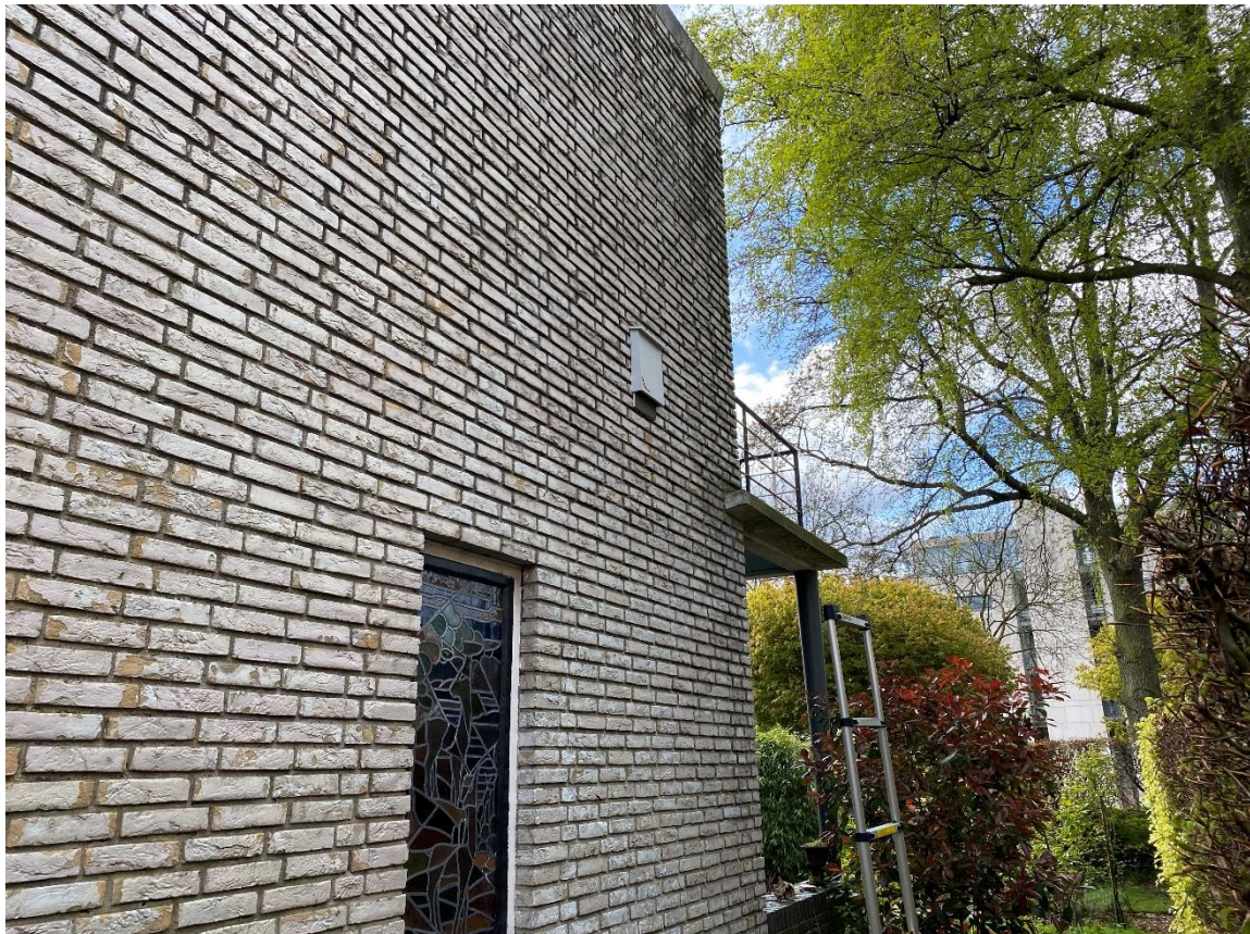
afbeelding 7. Johann Sebastian Bachlaan nr 2 zijkant woning