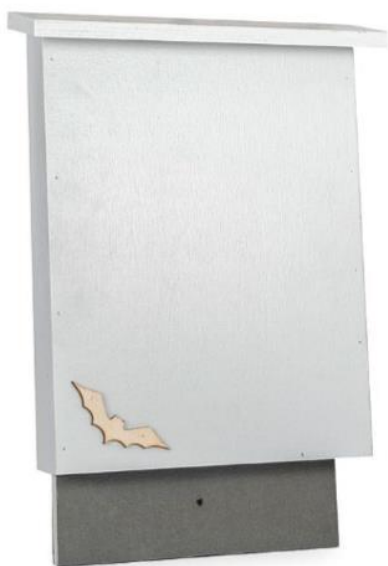
Afbeelding 1. het type VK MP 07 vleermuiskast dat in 2023 is gebruikt.

De 8 opgehangen vleermuiskasten in 2023, zijn van het type VK MP 07 van Unitura (afbeelding 1).