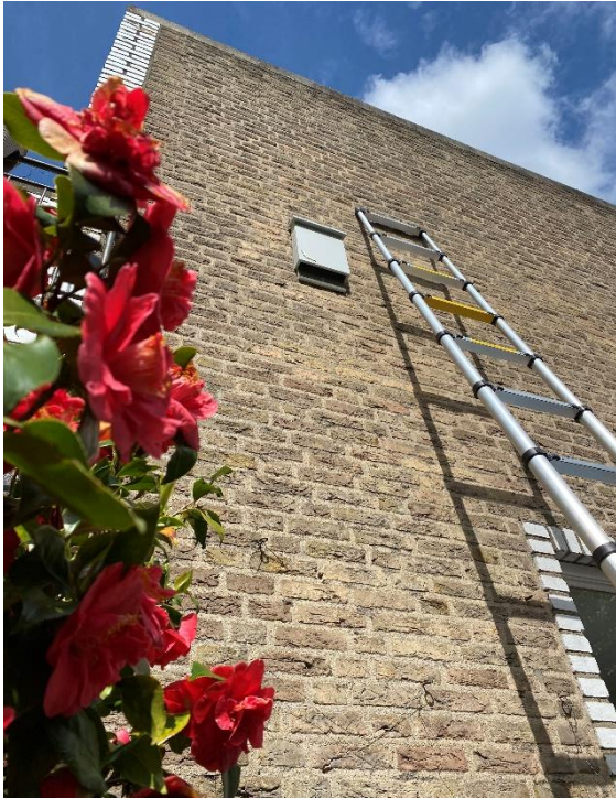
afbeelding 5. Johann Sebastian Bachlaan nr 6 zijkant woning