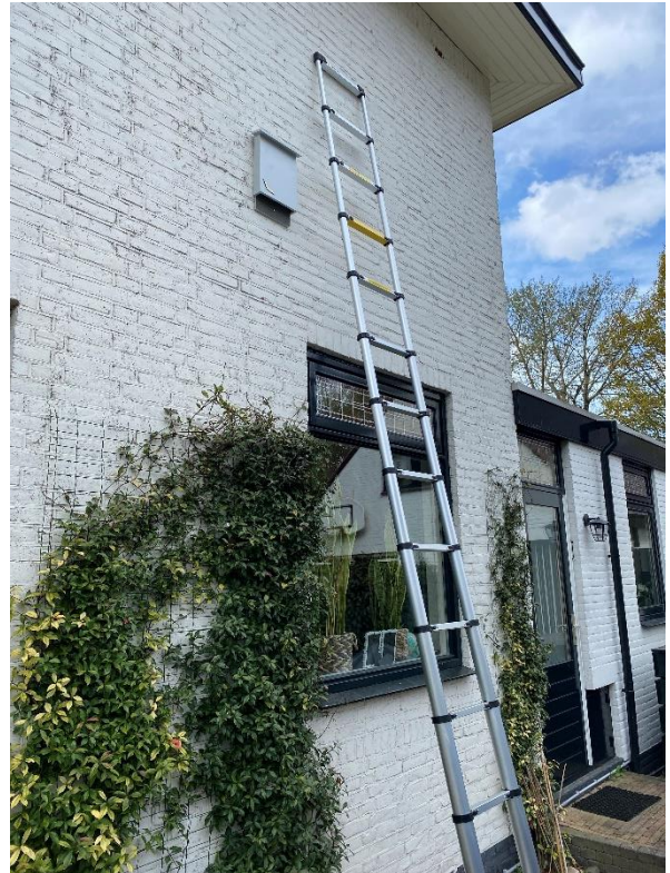
Afbeelding 9. Van Ruysdeallaan nr. 35 zijkant woning