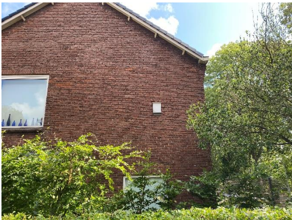
afbeelding 30. Van Ruysdeallaan nr.17 zijkant woning