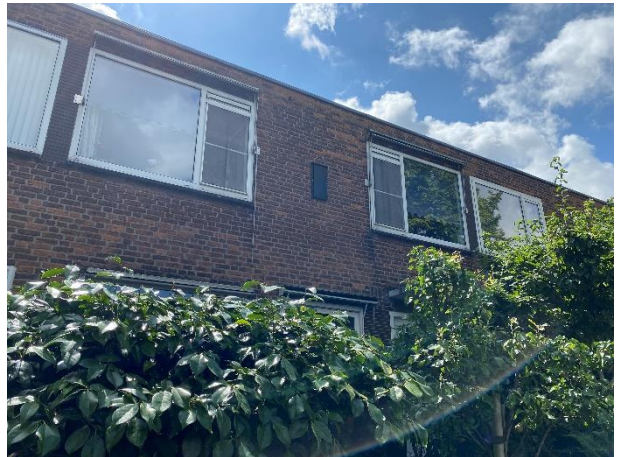
Afbeelding 3. De 4 vleermuiskasten die in 2020 zijn opgehangen. Rechtsboven is scoutinggebouw en linksboven is de stadstuin. Beneden zijn woningen.