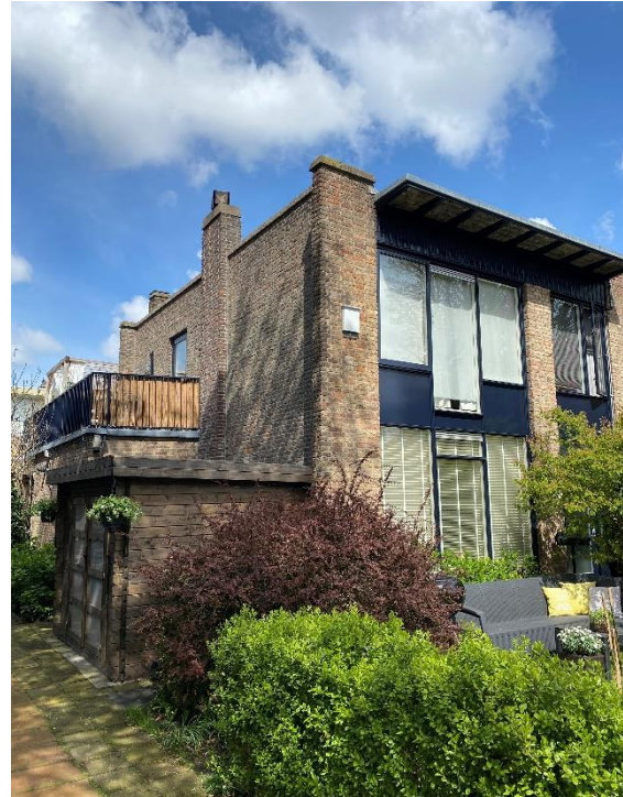
afbeelding 6. Schubertlaan nr 1 voorzijde woning.