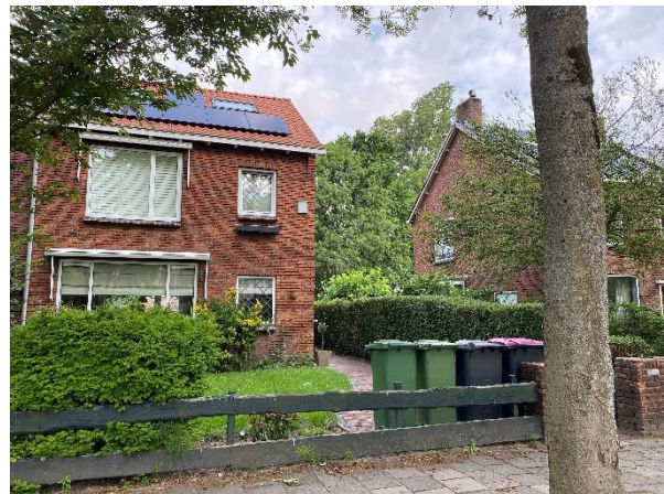
afbeelding 11. Van Ruysdeallaan nr.15 voorzijde woning