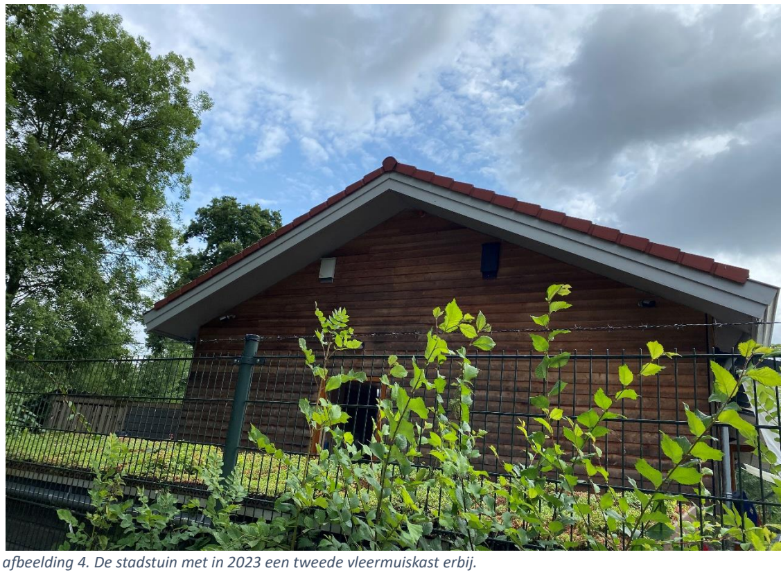
afbeelding 4. De stadstuin met in 2023 een tweede vleermuiskast erbij.