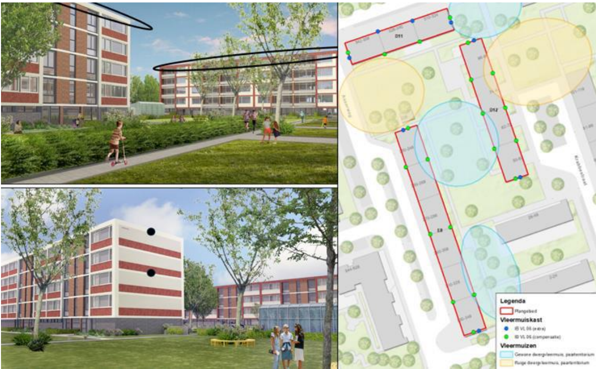
Figuur 3 De twintig groene bolletjes ter markering van de kasten die ter compensatie van de vijf paarverblijven opgehangen worden en acht extra kasten (blauwe bolletjes) ter mitigatie van mogelijke cumulatieve effecten. In totaal dus 28 permanente inbouwkasten van het type IBVL06 van Unitura of vergelijkbaar.