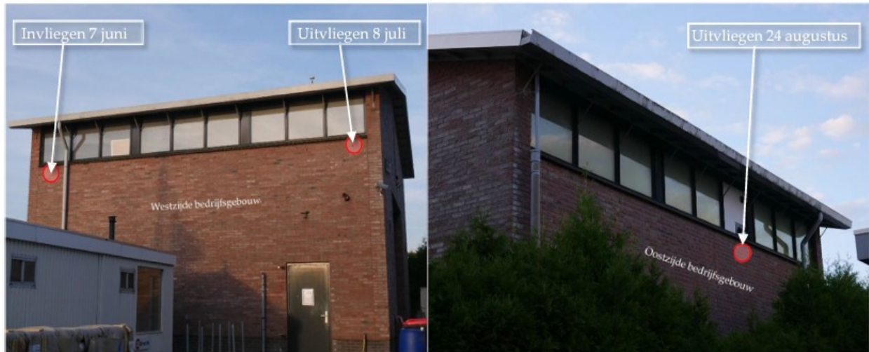
Foto 1 en 2: Vastgestelde verblijfplaatsen Gewone dwergvleermuis Vinkebuurt 126 te Zwammerdam.