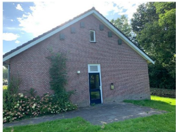
Foto 26 en 27 : voorzijde en achterzijde van 't Barbiertje met aan elke zijde 6 tijdelijke vleermuiskasten (ANS-1 Bat box)