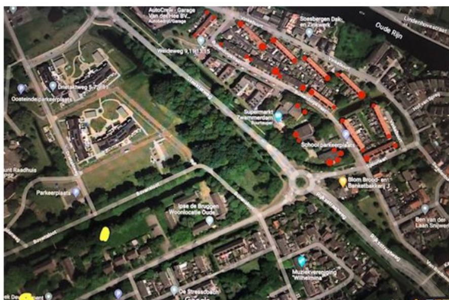
Foto 29: Inventarisatie van door de initiatiefnemers van reeds aanwezige tijdelijke en permanente vleermuisverblijven nabij en op enige afstand van het plangebied. (rode stip inbouwsteen of tijdelijke vleermuis kasten, gele stip paalkasten). NB het plangebied ligt net buiten deze foto aan de bovenzijde.