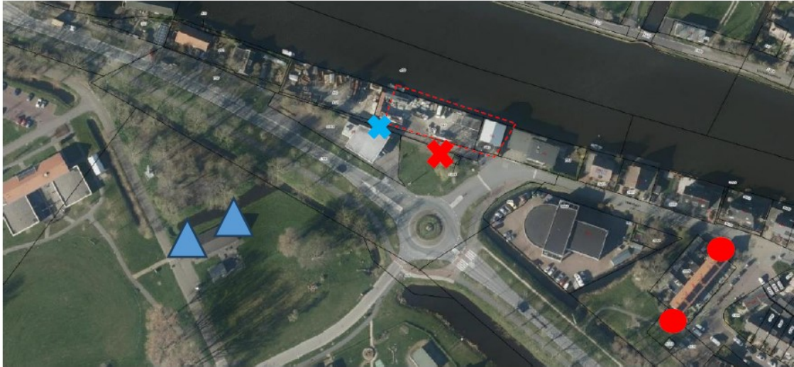
Foto 28: 12 tijdelijke vleermuiskasten (type ANS-1 bat box) aan gevels 't Barbiertje (Blauwe driehoek betreft meerdere vleermuiskasten verspreidt in omgeving tot aantal van 12 stuks – dus geen 12 kasten aan één gevel). Afstand tot het plangebied bedraagt 100-200 meter. Paalkast (blauwe kruis) en afgekeurde vier tijdelijke vleermuiskasten (rode kruis). Inbouwstenen nabij het plangebied (rode stip).