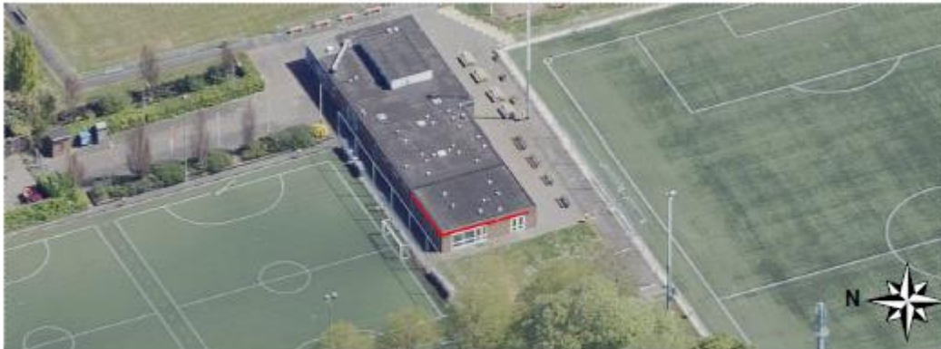
Figuur 5: in rood aangegeven waar de uitvliegers (gewone dwergvleermuizen) zijn waargenomen.