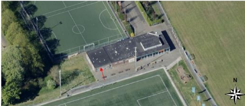
Figuur 4: invlieglocatie gewone dwergvleermuis (rode pijl)