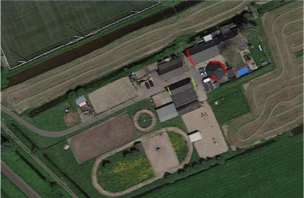
Afbeelding 7.1. Locaties tijdelijke vloermuiskasten, aangegeven met rode lijnen. Op elke windrichting hangen 2 kasten. De locaties van de aangetroffen verblijven is aangegeven met groene lijnen.