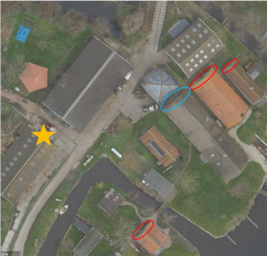
Figuur 9.1: Locaties ten opzichte van de huidige nestplaatsen (oranje ster) waar tijdelijke nestkasten voor de huismus geplaatst zijn (blauwe ovaal) en geschikte gevels waar de overige kasten nog opgehangen dienen te worden (rode ovalen)