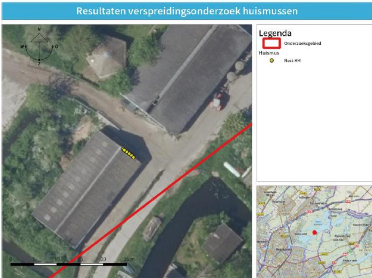
Figuur 6.1: Overzichtkaart met nestlocaties van huismussen

Er zijn in totaal tien nesten van huismussen geteld in de stal ten zuidwesten van het onderzoeksgebied (zie figuur 6.1). Alle nesten bevinden zich tussen de damwandplaten en de windveer (zie figuur 6.2).