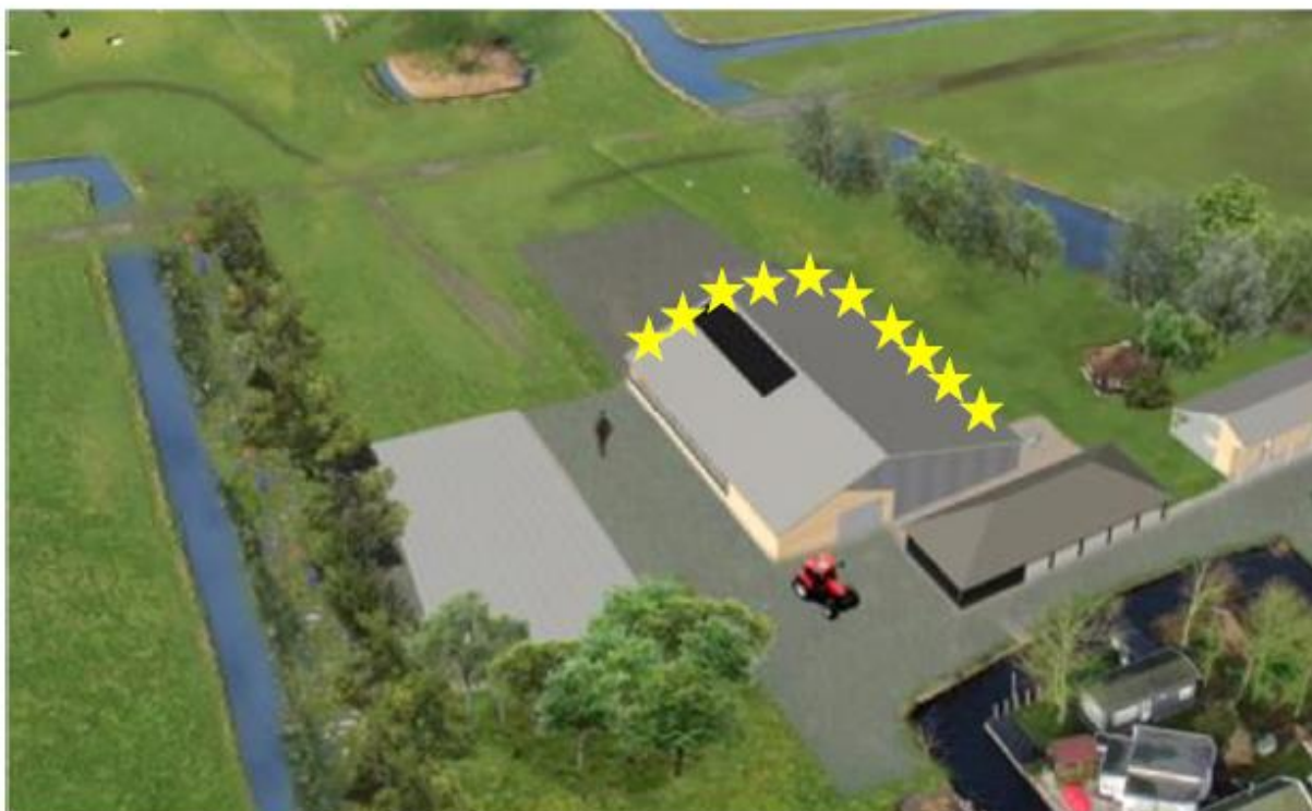
Figuur 9.6: Voorbeeld voor situering permanente huismuskasten waarbij een gele ster een dubbele huismusnestkast weergeeft