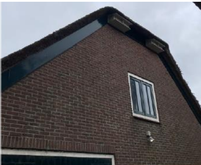
Figuur 9.3: Tijdelijke nestkast aan noordwestgevel schuur