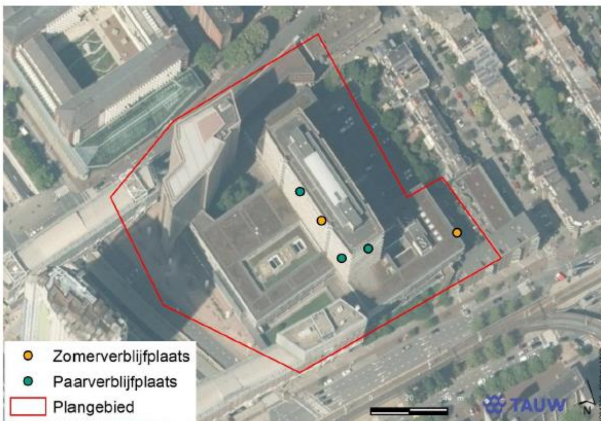
Figuur 5.4 Waargenomen zomerverblijfplaatsen (oranje stippen) en paarverblijfplaatsen (groene stippen) van gewone dwergvleermuis binnen het plangebied