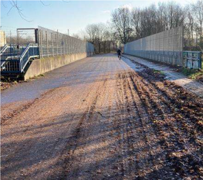
Figuur 1 De Bosgang op het Lam in de huidige situatie richting Wilhelminapark (projectplan).