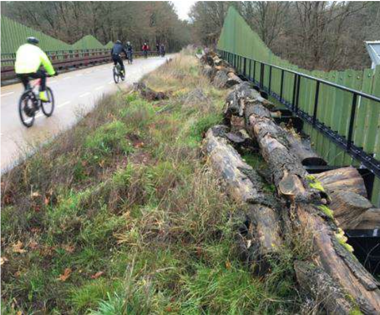
Figuur 2 Indicatie van de gewenste situatie - Gareelweg Bergen op Zoom (projectplan).