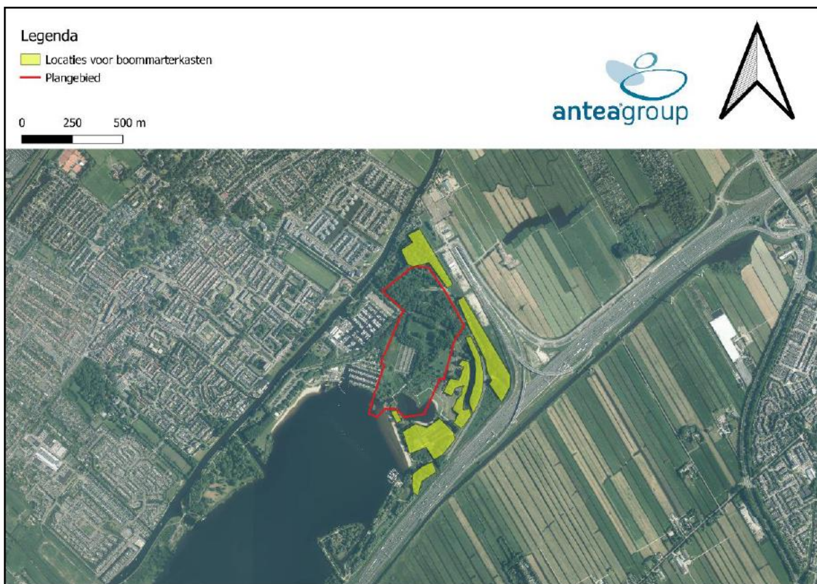
Figuur 6.3. De delen waar de boommarkerkasten worden geplaatst, zijn geel weergegeven.