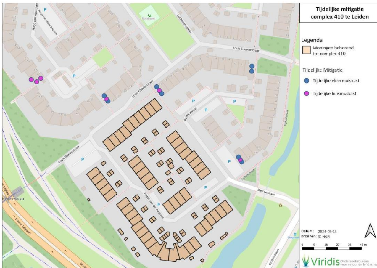
Figuur 1: Locaties tijdelijke voorzieningen huismuis en gewone dwergvleermuis, geplaatst op 24 maart 2024.