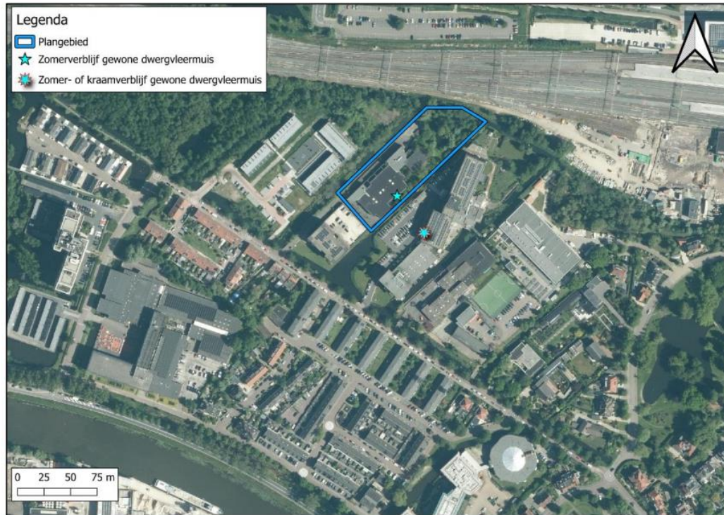
Figuur 1 Locaties van zomerverblijf Winterdijk 10 (plangebied blauw omkaderd) en groot zomerverblijf Winterdijk 8 te Gouda