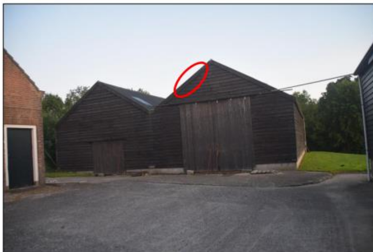
Houten schuur waar zomerverblijf in de dakrand is aangetroffen (rode cirkel).