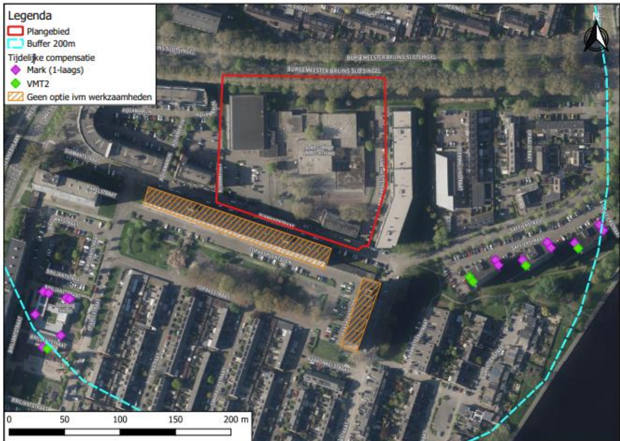
Figuur 2 locatie alternatieve voorzieningen 5 VMT2 Unitura dubbellaags en 15 Mark 1-laagse van Bats and Birds vleermuiskasten.