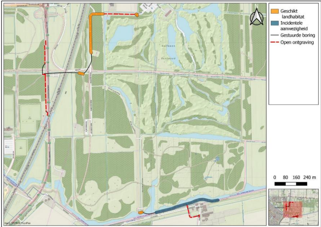
Figuur 2 Kaart met geschikt habitat voor de rugstreepdad en incidentele aanwezigheid