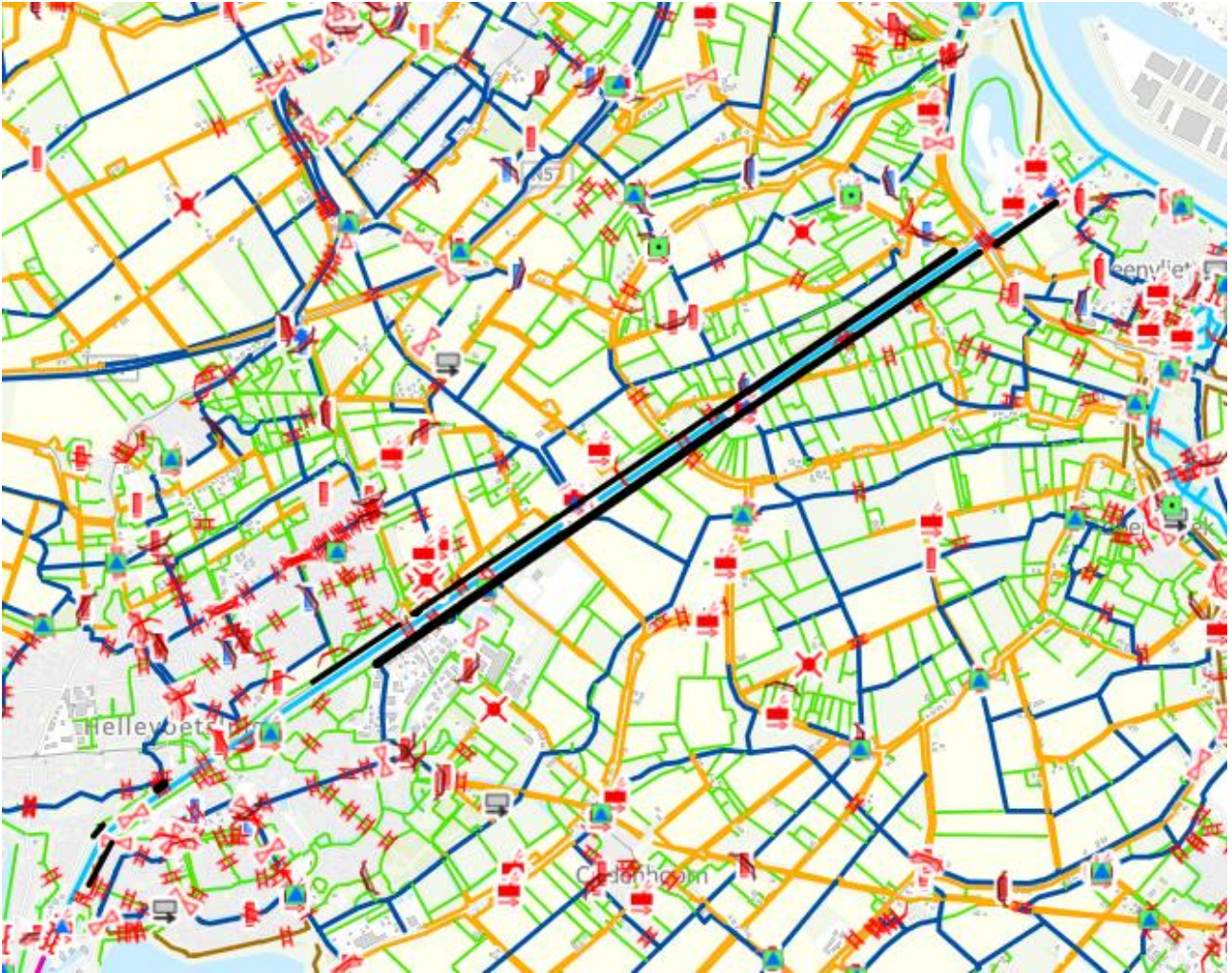
Figuur 2: Een kaart van Kanaal door Voorne met in zwarte lijnen langs de wateren waar het afschot van bevers zal gaan plaats vinden, aan de binnenzijde van het Kanaal.