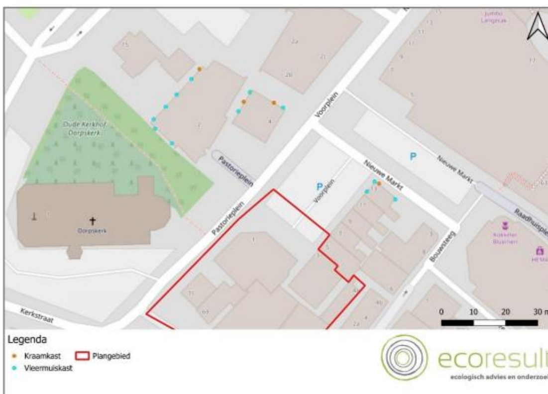
Figuur 5: Locaties van de geplaatste tijdelijke kasten. Kaartbron: OpenStreetMap

Bron: Activiteitenplan gewone dwergvleermuis en laatvlieger, Ecoresult., 22 augustus 2024.