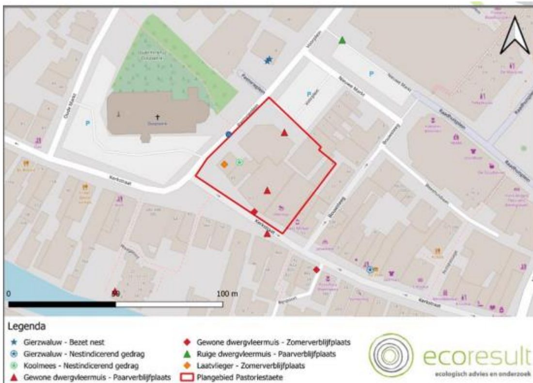
Tabel 3. De locaties van de aangetroffen vaste rust- en verblijfplaatsen van gewone dwergvleermuis binnen en buiten het plangebied. Met donkergrijs aangegeven de vaste rust- en verblijfplaatsen buiten het plangebied.