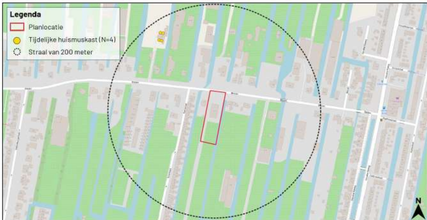
Figuur 2 Overzicht met mogelijke locaties voor tijdelijke voorzieningen