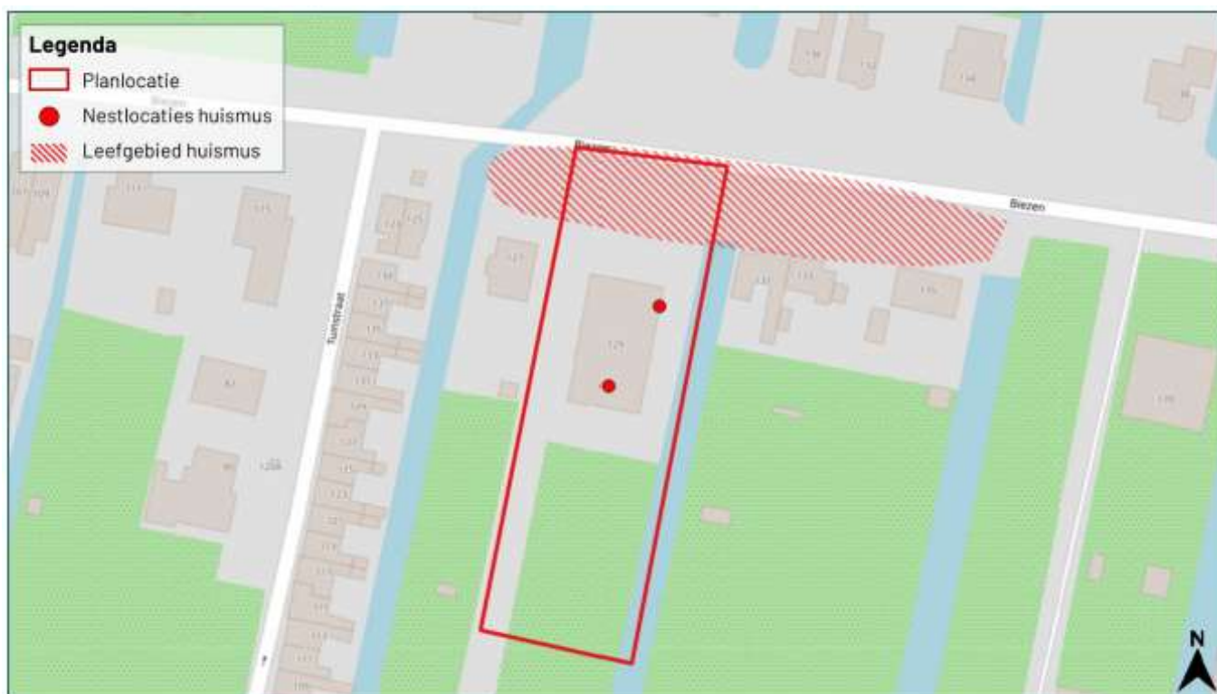
Figuur 1 Overzicht met aangetroffen verblijven