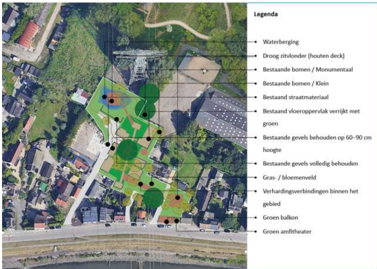
Figuur 2: De permanente voorzieningen zijn aanwezig in de twee gebouwen waar de gevels volledig behouden blijven (aangegeven met zwarte lijnen).