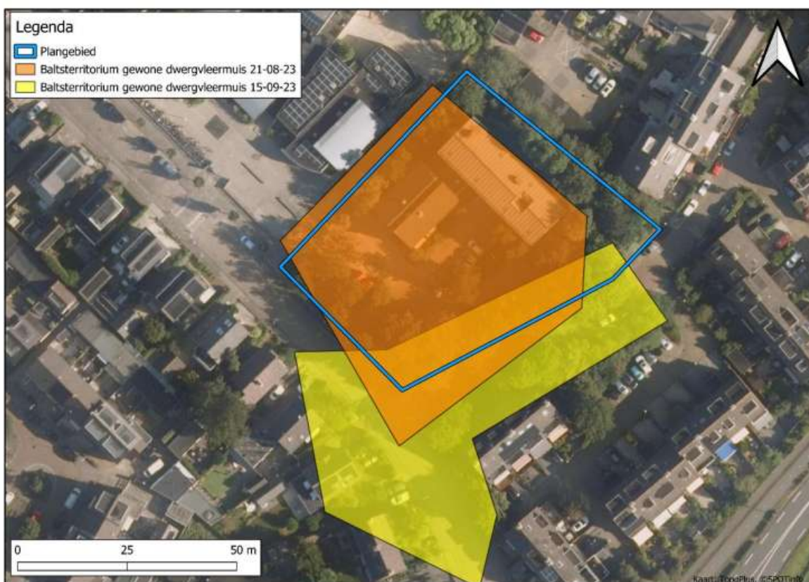
Figuur 4: De locatie van de aangetroffen verblijfplaats binnen het plangebied.