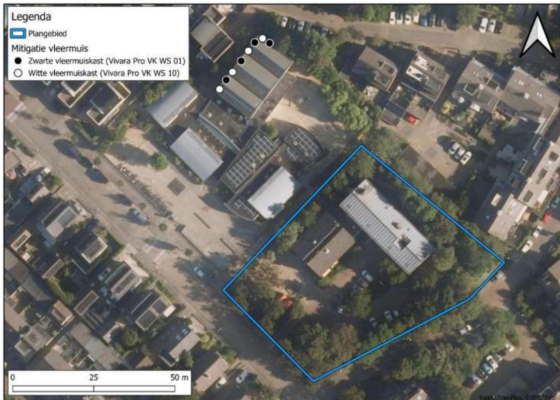
Figuur 5: In de buurt van het plangebied zijn in april 2024 acht vleermuiskasten opgehangen. De locaties zijn in de kaart weergegeven met witte en zwarte stippen.