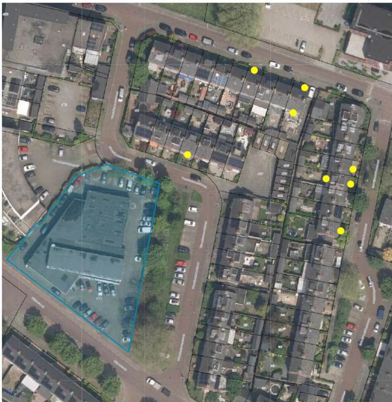
Figuur 2 Plangebied (blauw gearceerd) met de locaties van de gerealiseerde vlermuiskasten (gele stippen). Uit Activiteitenplan van 28 augustus 2025.