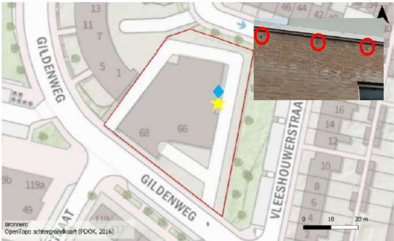
Figuur 1 Planlocatie rood omlijnd. Gele ster is de zomerverblijfplaats, blauwe ruit is de paarverblijfplaats. Ingevoegd een foto van de locatie van de verblijfplaatsen. Uit 'Aanvullend soortspecifiek onderzoek' van 8 december 2022

Aangetroffen verblijfplaatsen gewone dwergvleermuis