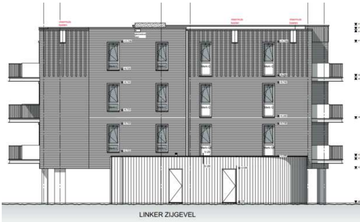
Figuur 3 Locaties van permanente vleermuis voorzieningen zijn weergegeven met rode tekst. Uit 'reactie op verzoek om aanvullingen Gildenweg 66-68 te Gorinchem' van 8 december 2025