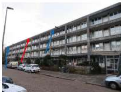
Foto 2: aangetroffen zomerverblijfplaats van de gewone dwergvleermuis (rode pijlen) en paarverblijfplaatsen van de ruige dwergvleermuis (blauwe pijlen).