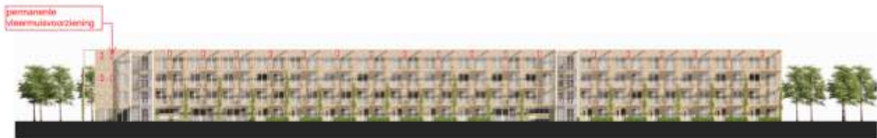
Westgevel (2024 Klunder)