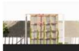
Noordgevel (2024 Klunder)

De klunder zijn overwegend losstaande (hoge klunder) en zijn gericht op de bebouwing in de omgeving.