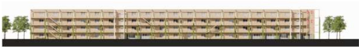
Oostgevel (2024 Klunder)