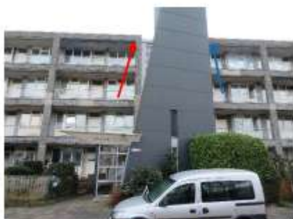
Foto 3: aangetroffen zomerverblijfplaats van de gewone dwergvleermuis (rode pijlen; hetzelfde als foto 2) en paarverblijfplaats van de ruige dwergvleermuis (blauwe pijlen).

Bron: 'Activiteitenplan' van 16 december 2025.