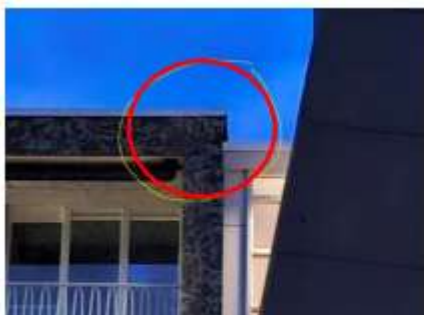
Foto 1: locatie zomerverblijfplaats gewone dwergvleermuis naast het trappenhuis.