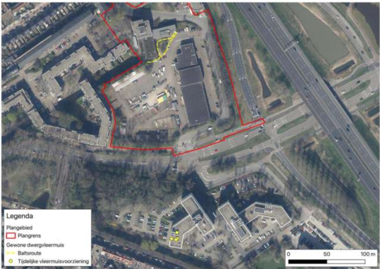
Figuur 2