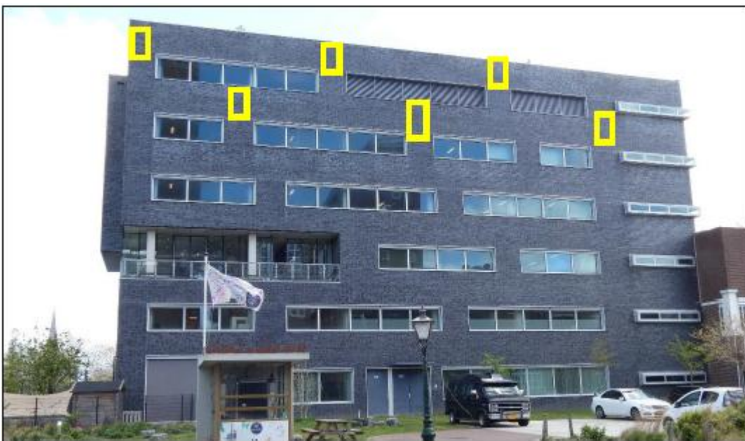
Figuur 5 Locaties van de tijdelijke voorzieningen op de westgevel (zes kasten) aan het Tweelinghuis.