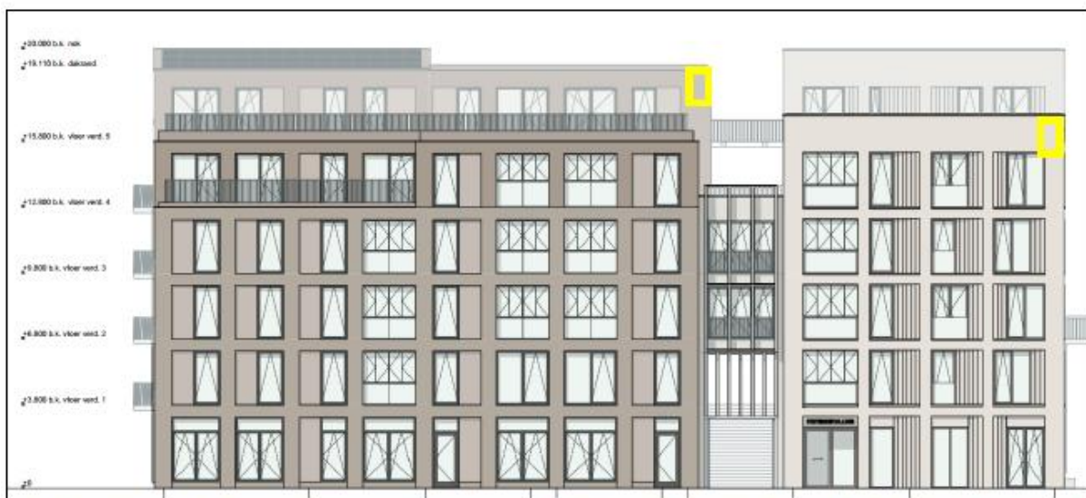
Figuur 8: Locaties van de permanente vleermuiskasten (geel kader) aan Langegracht (zijde Tweelinghuis). Deze kasten hebben een oriëntatie op zuid.