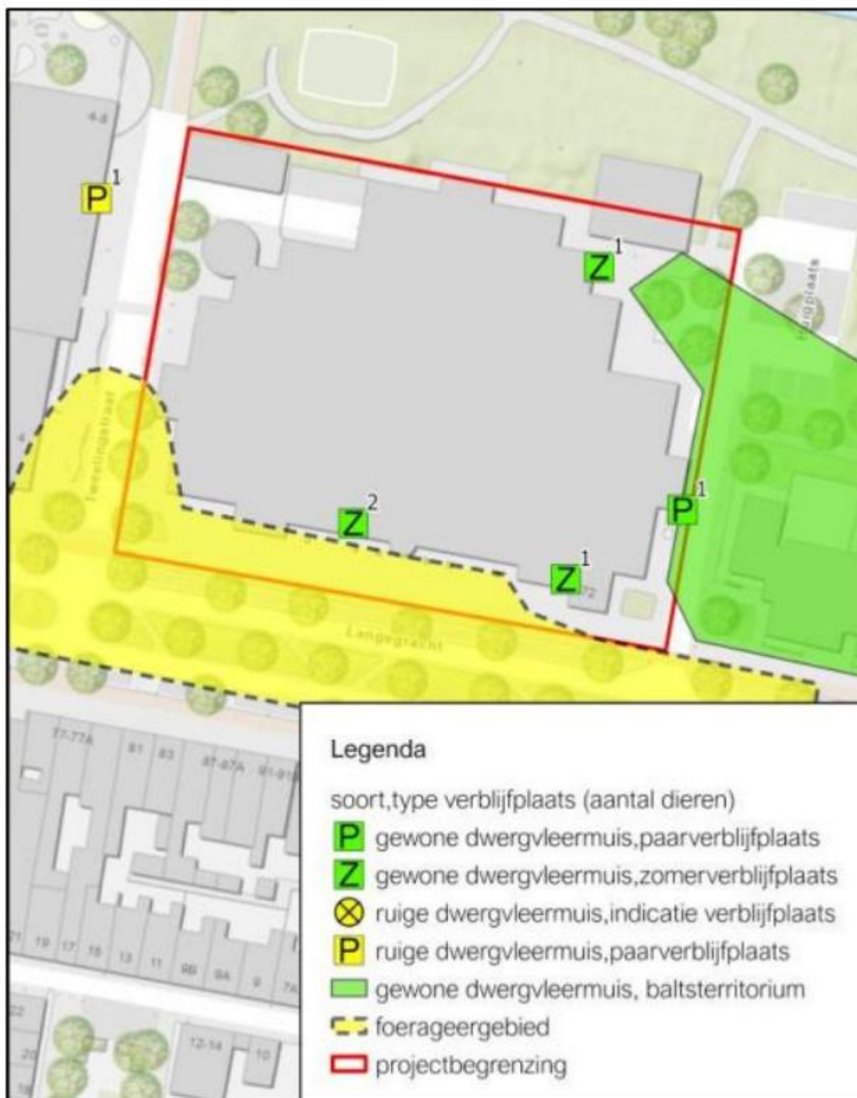
Figuur 2 Functionaliteit van het plangebied voor de gewone dwergvleermuis