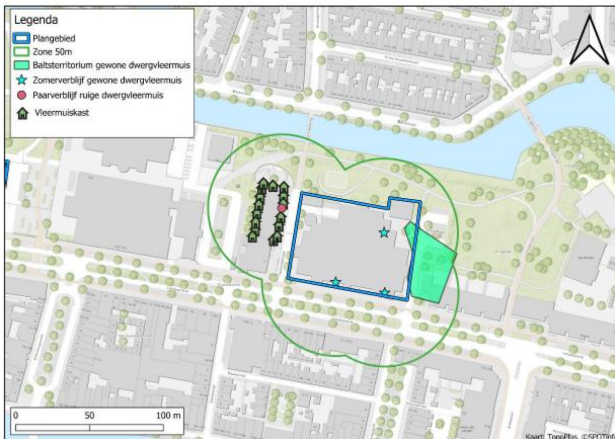
Figuur 3 Locaties van de tijdelijke voorzieningen ten opzichte van het plangebied aan de Langegracht 72 te Leiden