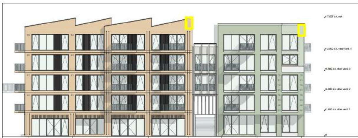
Figuur 12: Locaties van de permanente vleermuiskasten (geel kader) aan Parkzijde aan de kant van het Tweelinghuis. Deze kasten hebben een oriëntatie op noord.