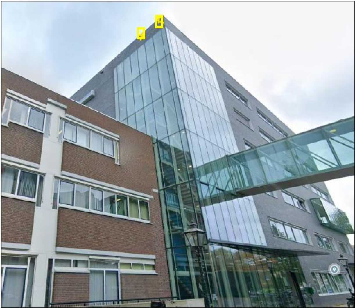
Figuur 6 Locaties van de tijdelijke voorzieningen op de zuidgevel (twee kasten) aan het Tweelinghuis.