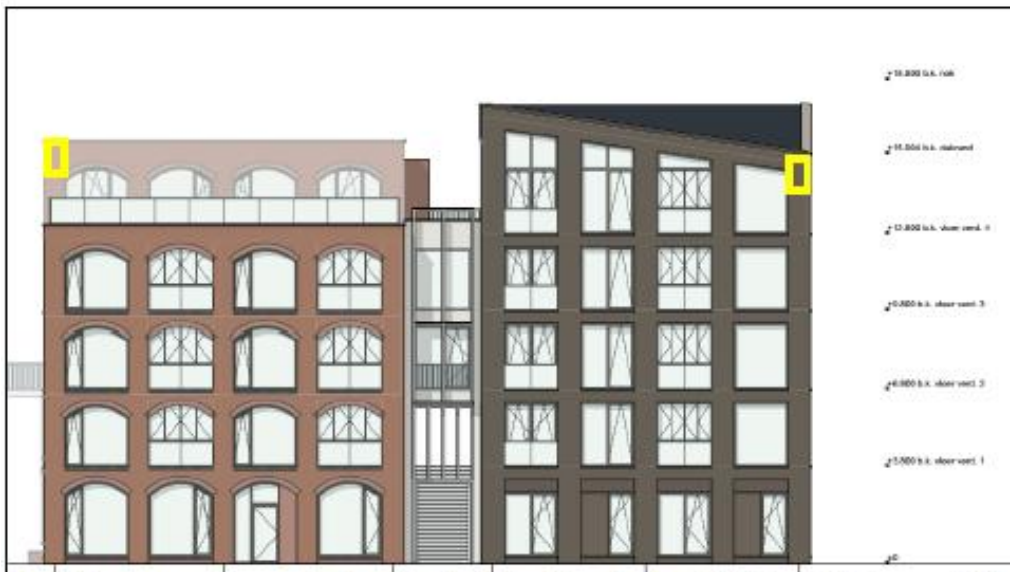
Figuur 9: Locaties van de permanente vleermuiskasten (geel kader) aan Langegracht (zijde woonblok Langegracht 84). Deze kasten hebben een oriëntatie op zuid.