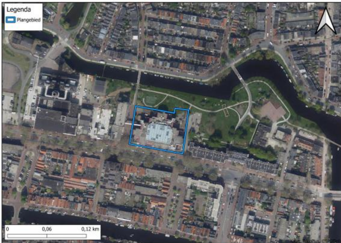
Figuur 1 Locatie van het plangebied aan de Langegracht 72 te Leiden