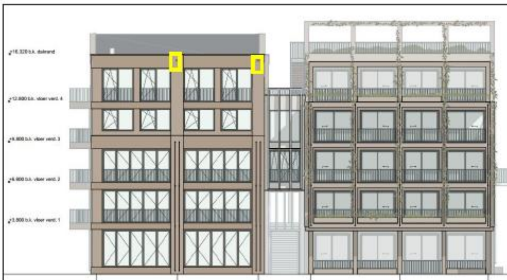
Figuur 11: Locaties van de permanente vleermuiskasten (geel kader) aan Parkzijde aan de kant van het woonblok aan Langegracht 84. Deze kasten hebben een oriëntatie op noord.