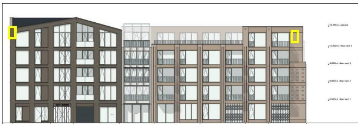
Figuur 7: Locaties van de permanente vleermuiskasten (geel kader) aan Huigpark. Deze kasten hebben een oriëntatie op oost.