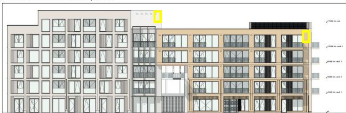
Figuur 13: Locaties van de permanente vleermuiskasten (geel kader) aan Tussenstraat Blok A. Deze kasten hebben een oriëntatie op oost.