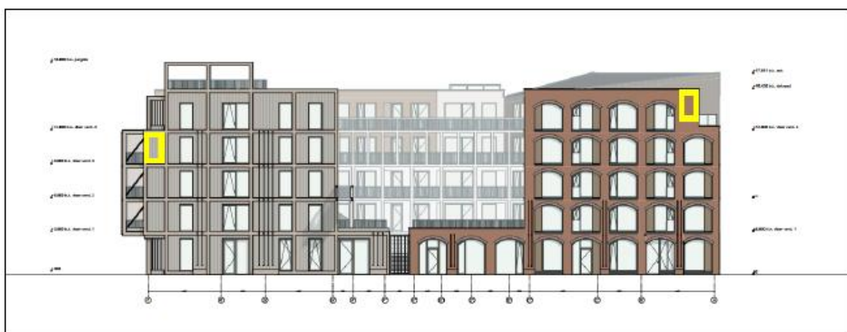
Figuur 14: Locaties van de permanente vleermuiskasten (geel kader) aan Langegracht. Deze kasten hebben een oriëntatie op zuid.