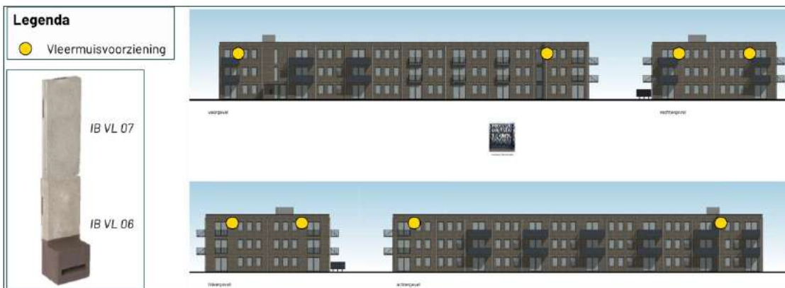
Figuur 3 Locaties van de permanente voorzieningen. Uit 'Mitigatieplan sloop A.P. van Neslaan 2-46 te Boskoop' door Blom Ecologie B.V. van 5 februari 2025.