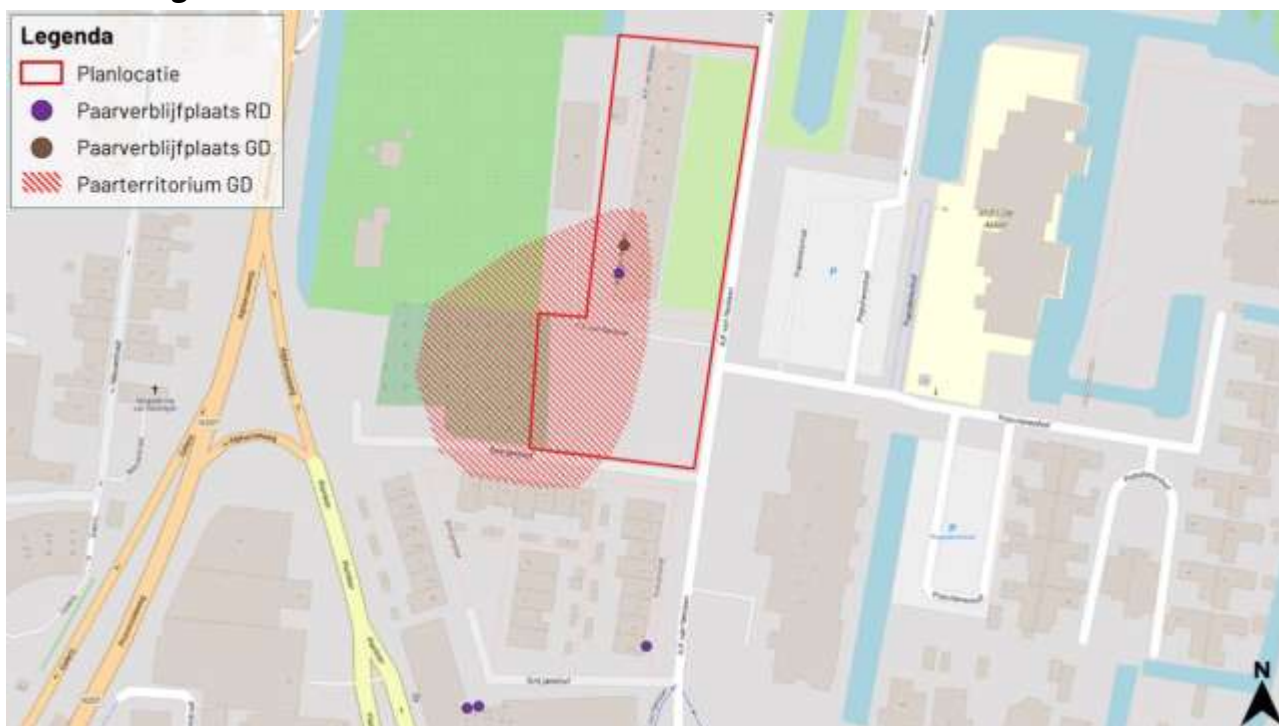
Figuur 1 Paarverblijven gewone- en ruige dwergvleermuis ten opzichte van het plangebied. In bruin het paarverblijf van de gewone dwergvleermuis, in paars de ruige dwergvleermuis. Rood gestreept gebied is het paar territoria van de gewone dwergvleermuis. Uit 'Aanvullend onderzoek ecologie A.P. van Neslaan 2-46 te Boskoop' door Blom Ecologie B.V. van 10 oktober 2024.