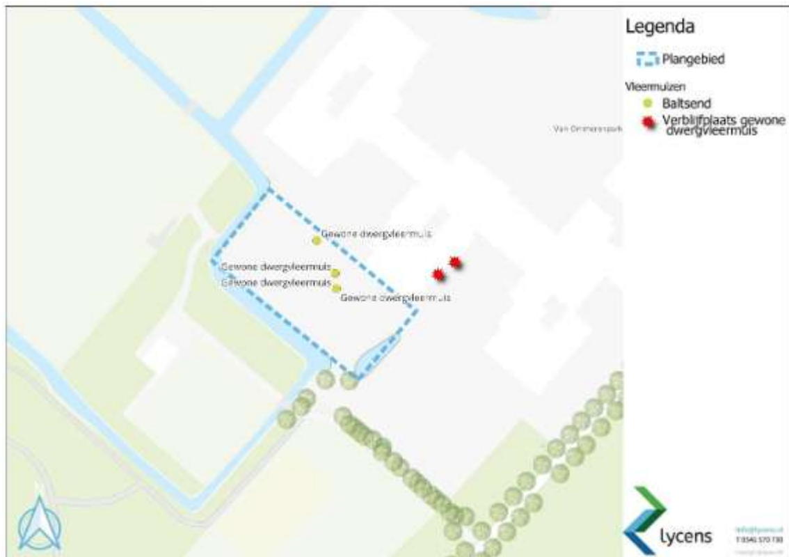
Figuur 2: Locaties van de aangetroffen verblijfplaatsen en baltsgedrag van de gewone dwergvleermuis.