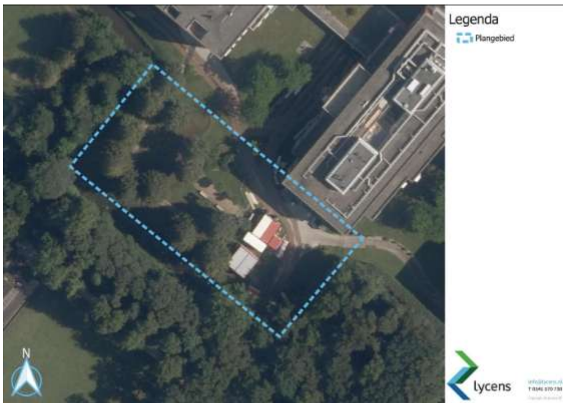
Figuur 1: Overzicht van het plangebied.